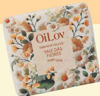
SABONETE BARRA 90g Caixa com 12 unidades