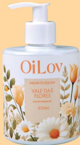
SABONETE LÍQUIDO 350 ml Caixa com 6 unidades