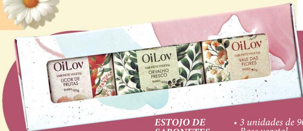
ESTOJO DE SABONETES